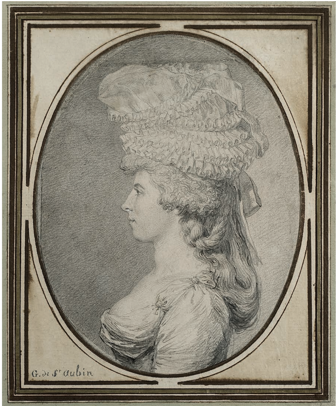
Taille réelle / actual size