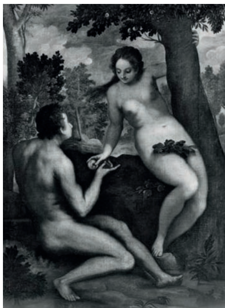
▲ Fig. 1 Palma le Jeune, Le Péché originel , Baltimore, The Walters Art Museum.

Cette étude de femme est préparatoire à la figure d'Ève dans Le Péché originel (fig. 1 ; Baltimore, MD, The Walters Art Museum). Alors que la majorité de ses dessins sont à la plume, Palma le Jeune préfère utiliser la pierre noire pour les études de personnages ; la texture permet de meilleurs effets de volume et de lumière, comme c'est le cas dans cette feuille, où Ève est saisie à l'instant où elle cueille la pomme. La nudité est élaborée en fonction de sa signification textuelle et symbolique. Ce canon physique au buste plutôt étroit posé sur des hanches aux formes très pleines se retrouve chez la plupart des héroïnes de Palma le Jeune. En revanche, les femmes tentatrices ou objets de tentation, comme les filles de Lot, les Suzanne et les Bethsabée, partagent avec Ève ce mélange particulier de pudeur et de volupté qui les rend irrésistibles. La forme serpentine parfaite du corps d'Ève est typiquement maniériste, mais se prête remarquablement bien au contexte de la Genèse, évocation du serpent qui a séduit la femme et qui l'a poussée à entraîner l'homme dans le péché.