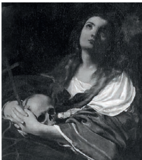
▲ Fig. 1 Giacomo Cavedone, Madeleine pénitente , Galleria Estense, Modène.

À l'exception de quelques fresques profanes, l'essentiel de l'œuvre peint de Giacomo Cavedone est de nature religieuse. Formé par les Carrache, et particulièrement par Ludovic, il baigna dans la forte atmosphère de Contre-Réforme qui régnait à Bologne sous l'influence du cardinal Paleotti (évêque puis archevêque de la ville successivement en 1567 puis 1582). Celui-ci avait publié son Discours sur les images sacrées et profanes en 1582, dans lequel il prônait la prudence dans le décorum, c'est-à-dire la vérité et la simplicité dans la représentation des sujets religieux. Très apprécié des communautés religieuses