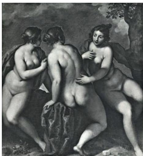
▲ Fig. 1 Palma le Jeune, Les Trois Grâces , Rome, Galleria dell'Accademia Nazionale di San Lucca.

La plume et l'encre brune constituent la technique la plus fréquemment utilisée par Palma, notamment dans la dernière partie de sa carrière féconde. Cette étude est préparatoire à la toile du même sujet conservée à la Galleria dell'Accademia Nazionale di San Lucca de Rome (fig. 1), que l'on date autour de 1611, période de la maturité de l'artiste. Il existe une autre composition très proche représentant Mercure et les trois Grâces, dans une collection privée en Suisse. Palma a réalisé pour les deux tableaux de multiples dessins préparatoires qui sont conservés à la Royal Library de Windsor, à la Fondazione d'Arco de Mantoue et au Kupferstichkabinett de Dresde. Stefania Mason