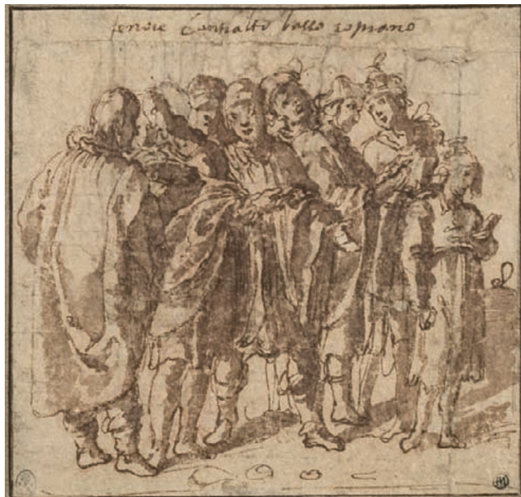
Taille réelle / actual size