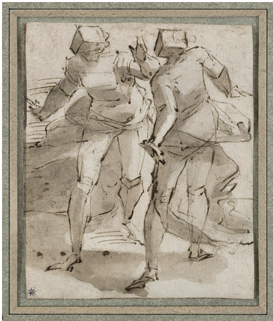
Taille réelle / actual size