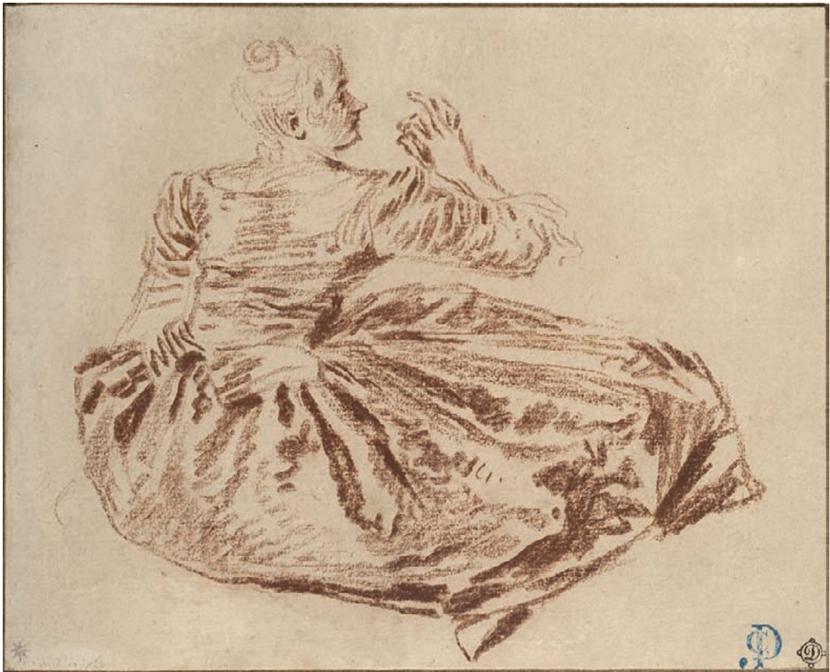
Taille réelle / actual size