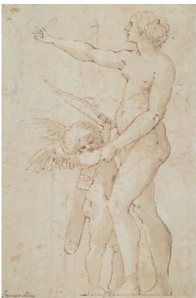
▲ Fig. 1 Verso.

L'exécution délicate et l'intimisme raffiné de cette feuille sont typiques de sa manière originale qui privilégie à cette époque des lavis légers sur un trait fluide et gracieux. Le sujet rappelle le monde de la célèbre gravure de son cousin, Agostino Carracci, Vénus fustigeant l'Amour , mais l'élégance et la légèreté du dessin évoquent presque l'univers des petits bronzes de ses contemporains vénitiens, Danese Cattaneo, Girolamo Campagna et Niccolò Roccatagliata. Sans que l'on soit dans un véritable paragone , la reprise de l'étude au verso sur les traits du recto accentue cette idée d'un parallèle avec la sculpture. Un seul détail est différent, les yeux de l'Amour, bandés au recto, ouverts au verso, comme un jeu sur le sens de cette figure de l'Éros que Vénus semble maintenir auprès d'elle tout en appelant quelqu'un ou en désignant quelque chose. Les yeux bandés de l'Amour sont depuis le XIII e siècle un motif poétique récurrent, et l'opposition entre « l'Amour aux yeux vifs » et le « Cupidon aveugle » renvoie à l'opposition entre la notion platonicienne de l'amour et son assimilation par le monde catholique médiéval à la fortune et la mort. À partir de la Renaissance, ce contraste devient un jeu d'esprit qui sera résumé par les notions d'amour sacré et d'amour profane ou Éros et Antéros 1 .