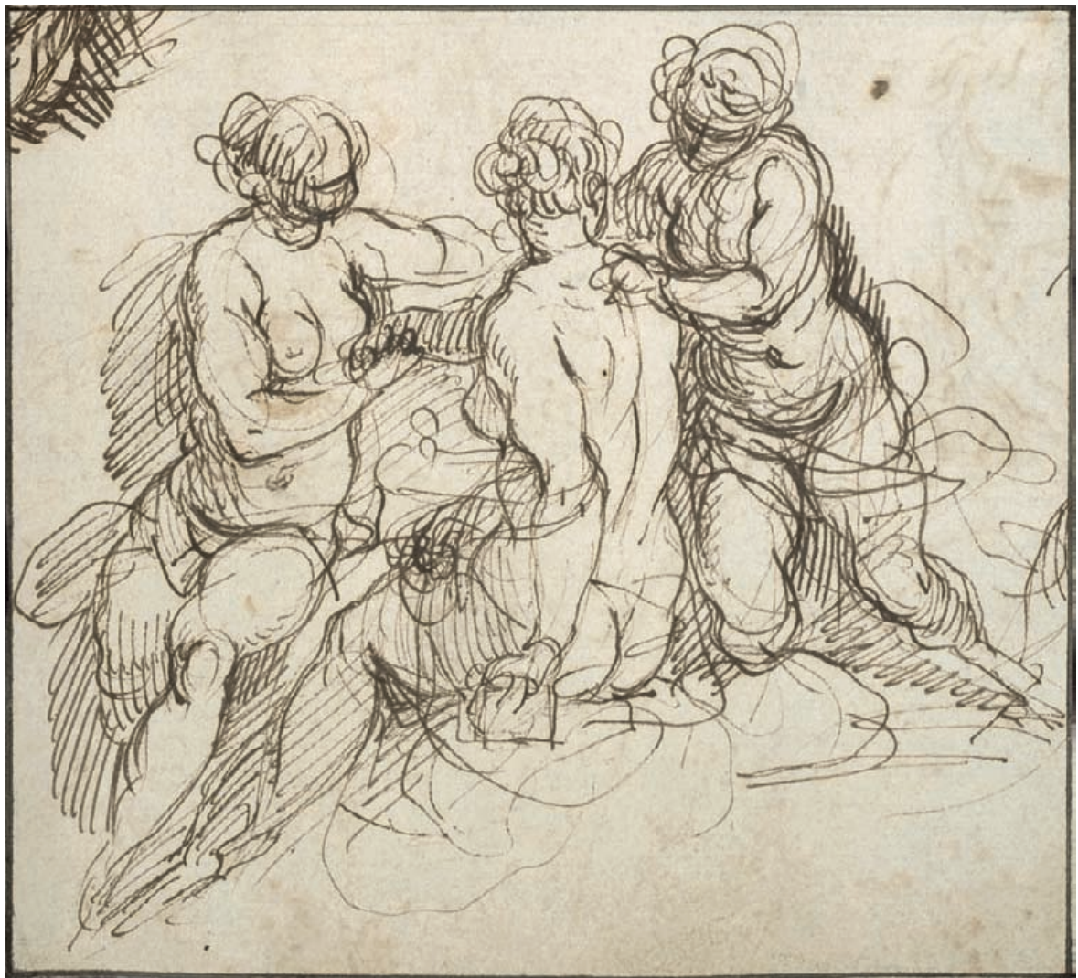
Taille réelle / actual size