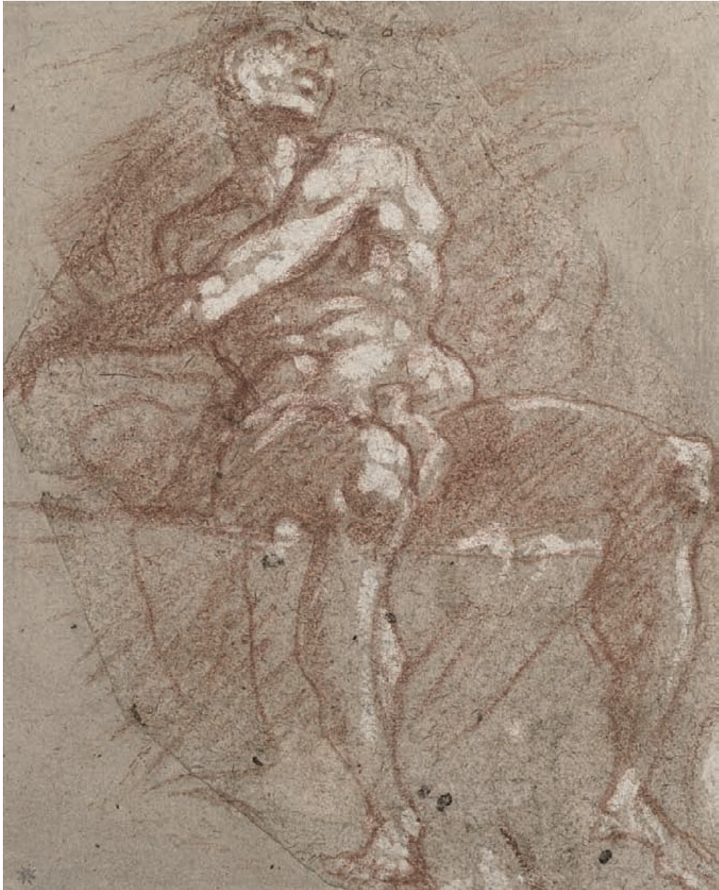
Taille réelle / actual size